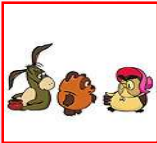
«Песенка Винни- Пуха» Муз. М. Вайнберг. Сл. Борис Заходер.