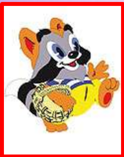
«Улыбка» Муз. Шаинский В., сл. Пляцковский М.