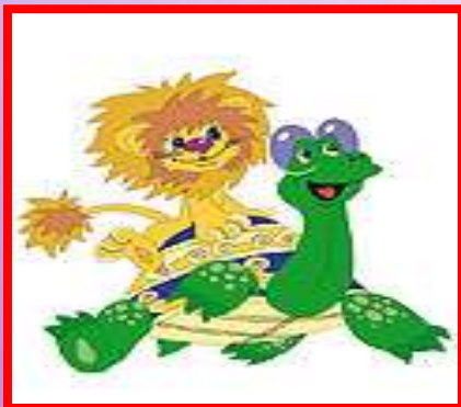
«Песенка Львенка и Черепахи» Муз.: Геннадий Гладков. Сл.: Сергей Козлов.